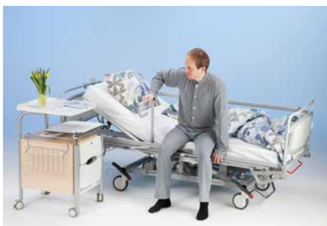
Большой выбор принадлежностей для позиционирования пациента.