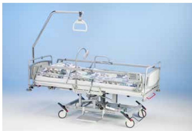
В гидравлической модели спинная и ножная секции регулируется при помощи пневмопривода.