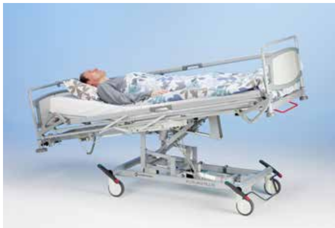
Пневмопривод регулировки Тренделенбург и экстренный привод спинной секции.