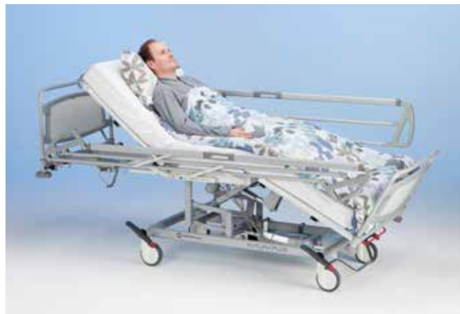
Трехсекционная модель дает возможность позиционировать пациента сидя для проведения различных процедур (например, положение Фовлера, кардиокресло).