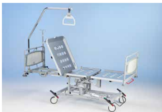
Принадлежности, расположенные со стороны спинной секции, не перемещаются при ее регулировке.