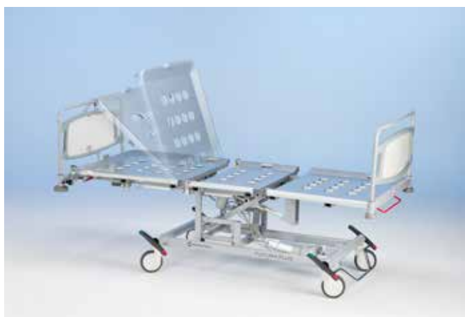
Обновленная модель спинной секции с продольным смещением для комфортного позиционирования пациента. Съемные секции ложа из ABS пластика.